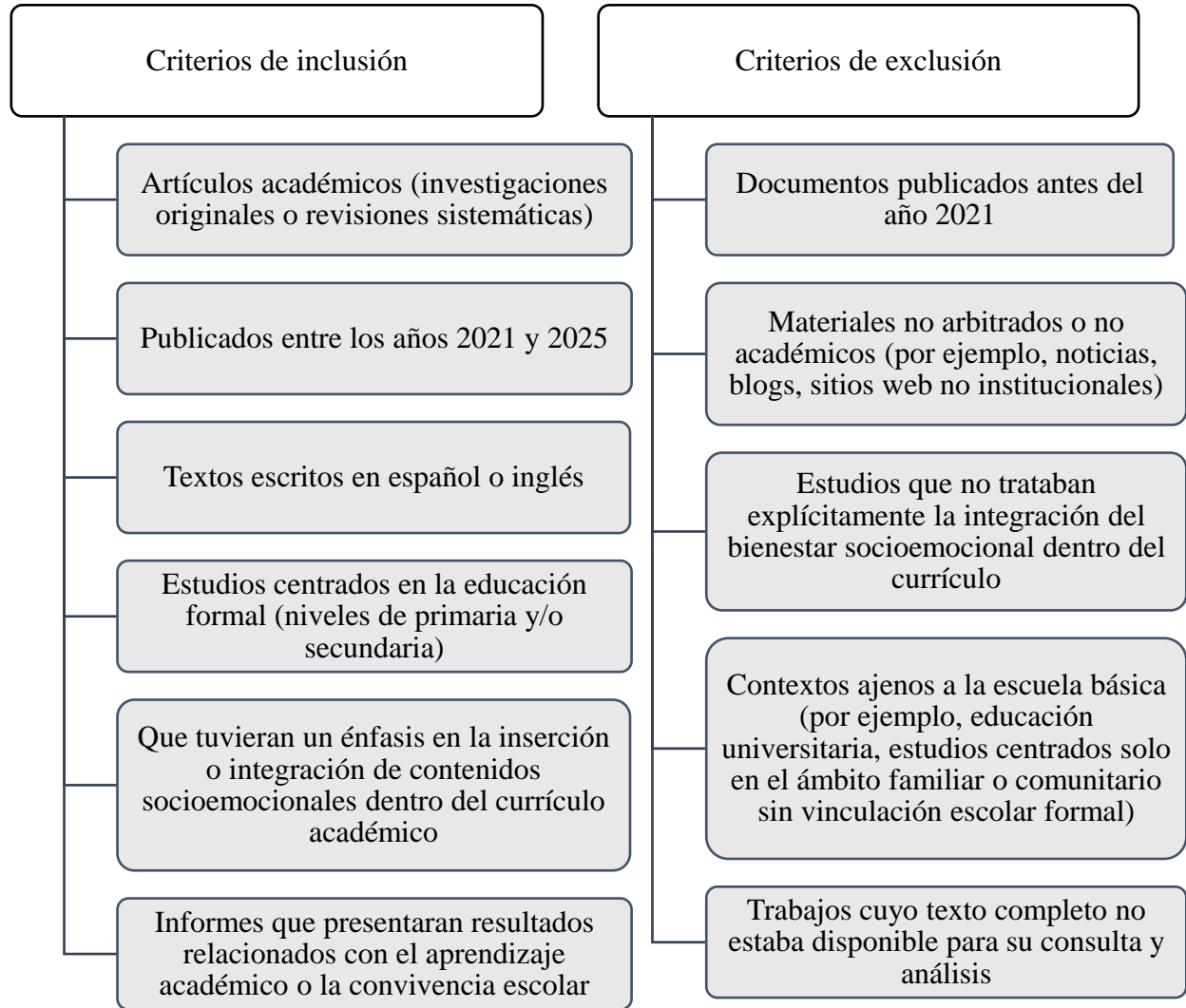
Fig. 1. Criterios de inclusión y exclusión utilizados